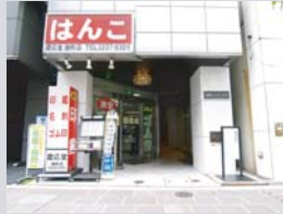
麹町シャインビル入口

東京都千代田区麹町4丁目4番麹町シャインビル305号室 tel. 03-5215-7696